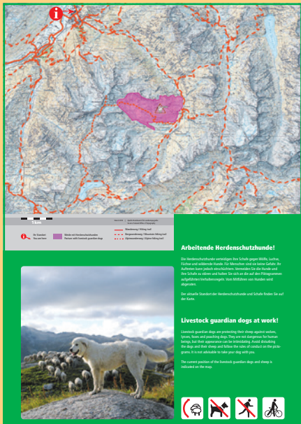
Exemple d'une feuille plastifiée double destinée à un grand panneau d'information (lieu : Andermatt UR).