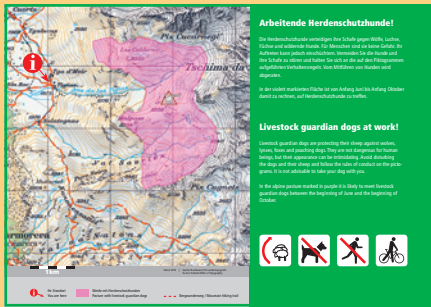
Exemple d'une feuille plastifiée simple destinée à un petit panneau d'information (lieu : Alp Flix GR).