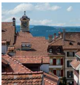
Murten / Morat

Région Lac de Morat ...Murten/Morat ...Le Vully ...Seeland