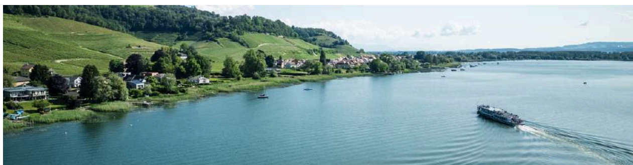
Region Murtensee / Région Lac de Morat